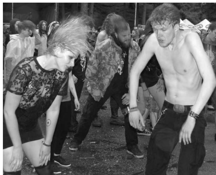
Vėlnių neatvėsino nė šeštadienio vakarą prapliūpus lietus.

koncertavo „PLANET OF ZEUS“, o Vakarų – visos dienos „vinis“ švedų grupė „KATATONIA“. Scenos mohikanai, karjerą pradėjo 1991 metais. „Šiandien „KATATONIA“ yra viena žymiausių, daugiausiai koncertuojančių ir sėkmingiausių