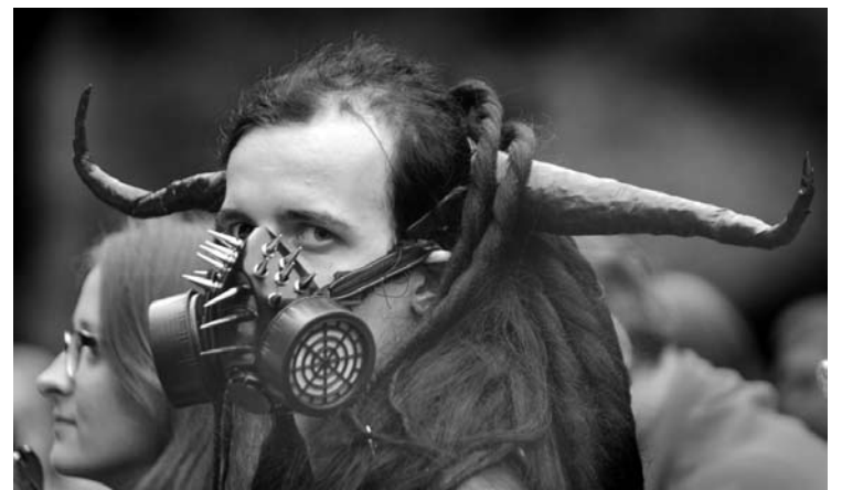
Tikri velniai - su ragais...

Penktadienį apie 17 val., pas 23-ejų metų vyriškį, džinsų kišenėje rastas maišelis su baltos spalvos, kaip įtariama, narkotinė medžiaga, o vidinėje striukės kišenėje rastas plastikinis buteliukas su mėsvos spalvos tabletėmis, kaip įtariama, narkotinė