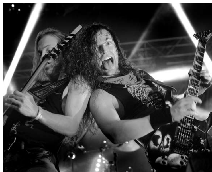
Vėly penktadienio vakarą koncertavo grupė iš Kanados „Striker“.

Keturkojis policininkas „Ūkas“ ir jį pakeitęs legionierius iš Utenos sutrukdė trims „velniams“ į festivalio teritoriją įsinešti narkotikų.