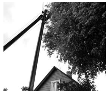
Liepos šaka gali atplyšti, nutraukti elektros laidus ar net sužaloti žmogų.