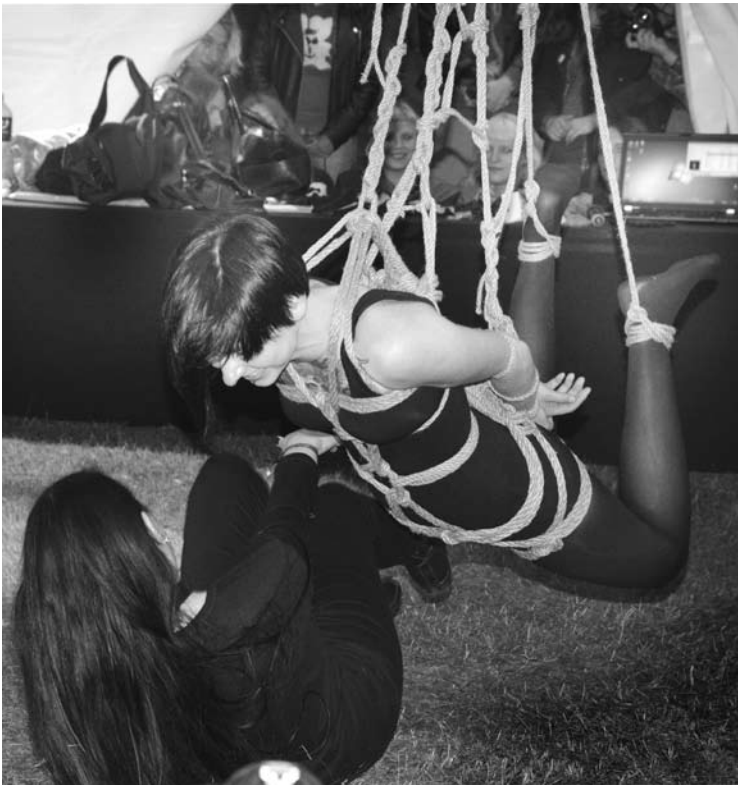
Moters „kankinimas“ performanse „Skausmas ir erotika“ truko 40 minučių...