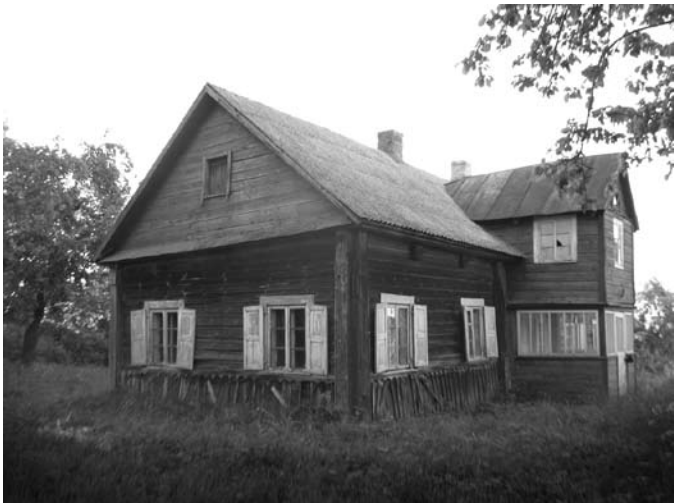
Vienas stilingiausių Svėdasuose – istorinis Mikulkų namas.